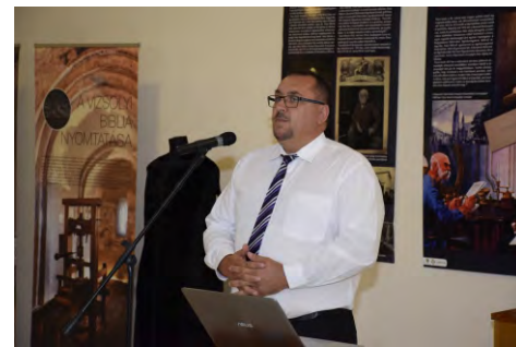
A protestantizmus öt évszázada az Alföldön című kiállítás szeptember 30-ig várja látogatóit a Martfű Városi Művelődési Központ emeleti galériáján. Magyar Mária

– A Mozgássérültek Martfűi Baráti Köre tagjait összeköti az azonos érdeklődés, az egymásra való figyelés, törődés és az alkotás öröme. Aktívan bekapcsolódnak a Művelődési Központ és a település programjaiba, részt vesznek rendezvényeiken. Céljuk, ahogy ők fogalmazták: „Lássák a településen élők, hogy ők is léteznek”, és fotóikkal il-